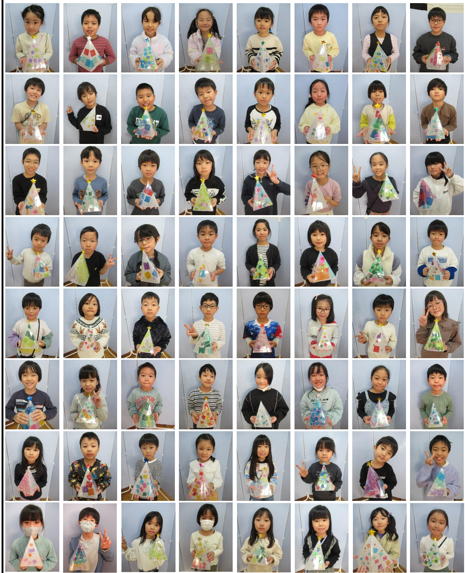
ゆらゆらと光るクリスマスランプを作りました ✨

横浜市神奈川区浦島丘16 横浜市立浦島小学校内 Tel & Fax 045-401-5894 urashima-kids@royal.ocn.ne.jp