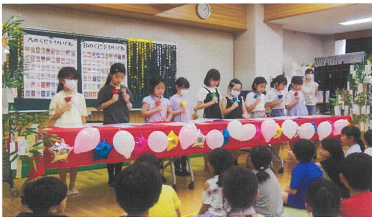
ハンドベルの発表♪