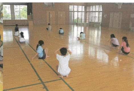
体育館：ゆっくり静かに 障害物リレーや 駒回し そして 声を出さずにジェスチャーゲーム

この他にも、うちわ作りや、ビンゴ大会など声を出さずに集中して遊べるゲームをして過ごしてきました。駒回しでは、各児童がどうやったら長く回すことができるのか工夫をしジェスチャーゲームでは声を発せず体を使って相手に物事を伝えるには？ と考えてみたりシャボン玉でも風向きを考えて大きなシャボン玉を作るには？ と、みんなそれぞれが知恵をだしながら遊ぶことができたようです。ご家庭では、お子様とキッズでの出来事などお話しはありましたでしょうか？ また是非、ご意見などお聞かせください。