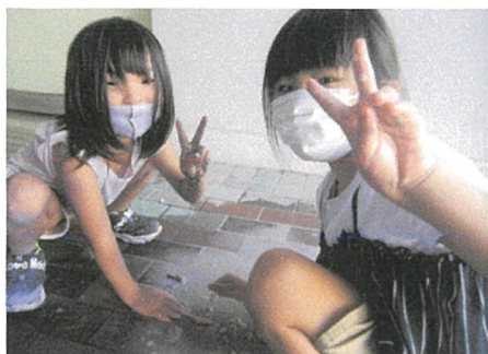
屋外：チョークで自由にお絵描き

保護者の皆様からアンケートを通じてご提案いただきました内容として「コロナ対策に工夫をしながら子どもを遊ばせてほしい」そんなご意見にお応えできるようスタッフ一同この夏休み期間中は3密を避けながらイベントを行い少しでも思い出となるよう活動してまいりました。