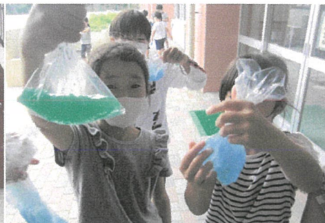
カラフルなスライム作り