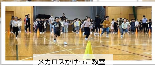
メガロスかけっこ教室