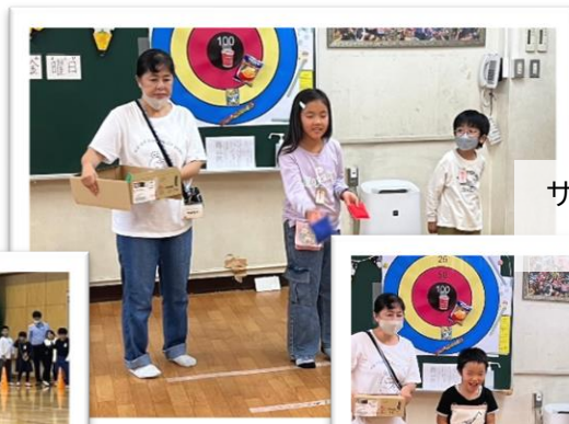
サプライズプログラム シートダーツ