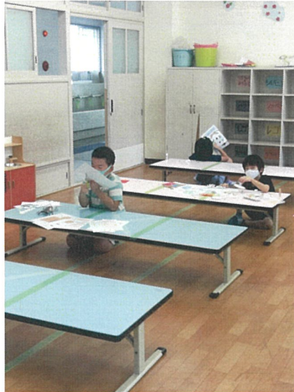
密にならないように座ります