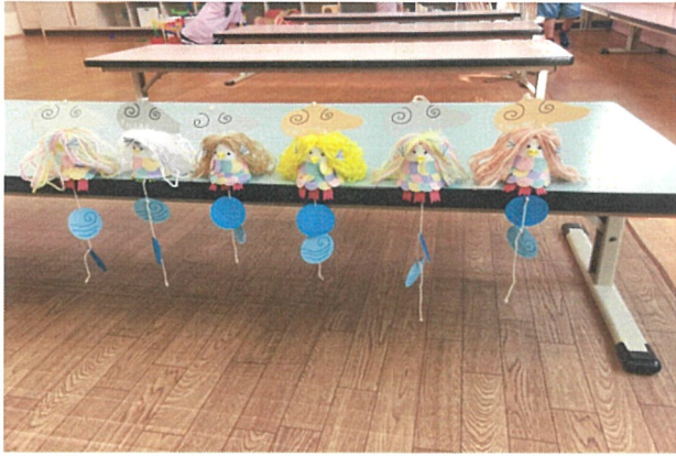
あまびえ作り (コロナ収束を願って)

校庭で遊べる日は、思い切り体を動かして汗びっしょりになって遊び、工作もたくさん作って活動していました。この状況はまだまだ続きそうですが、楽しいキッズになるようにしたいと思います。