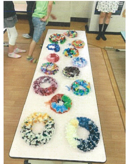
リボンリース作り