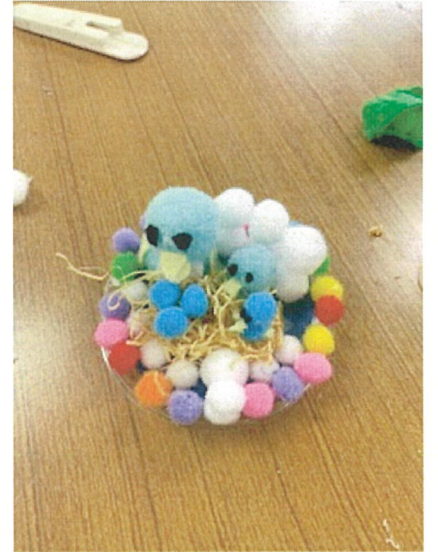
自由工作 (巣の中の小鳥)

※活動中の写真等をキッズニュース・HP等に掲載させていただきます。支障のある方は、ご連絡をお願いします。