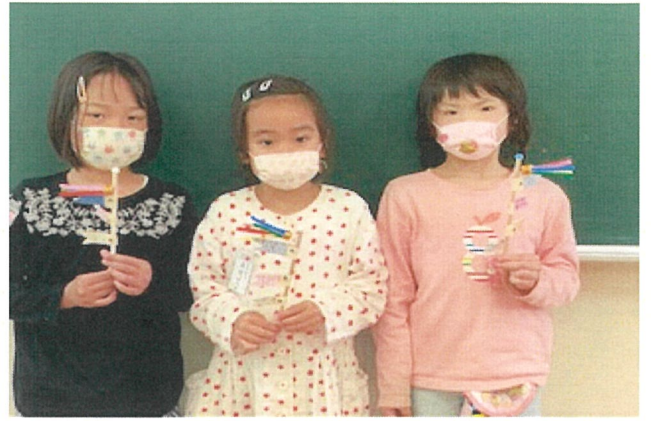
こいのぼり作り (こどもの日のお祝い)