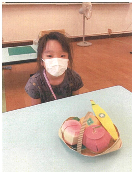
ペーパークラフト (果物)