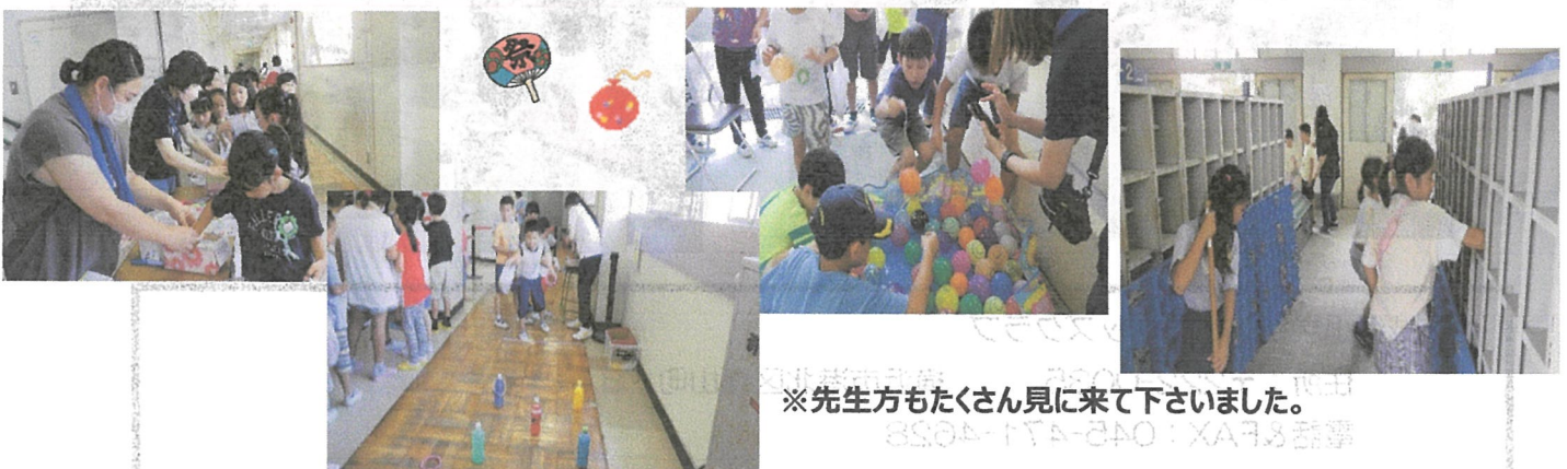
※先生方もたくさん見に来て下さいました。