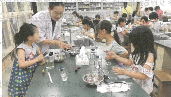
〈つかめる水を作ろう〉