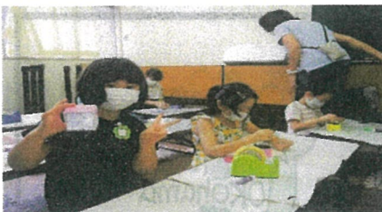
★牛乳パックの万華鏡できたよ！