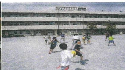
★親子タグラクビーのようす