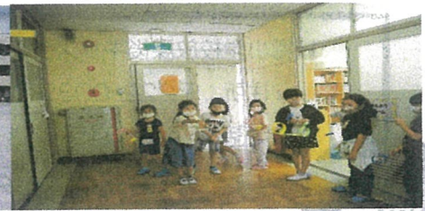
★輪っかのヒコーキ とばすぞ～