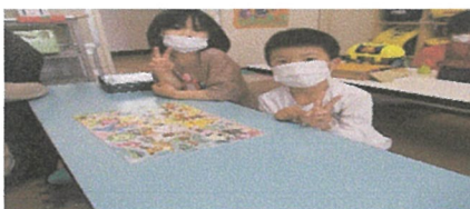
パズル 2人でできたよ～