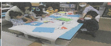
ありがとうカード工作