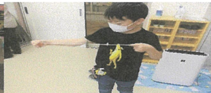
ブンブンコマ まわるよ