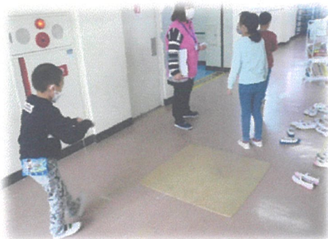
コマ廻しタイムトライアル