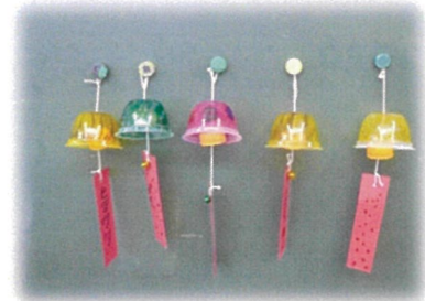
ゼリーカップで風鈴作り