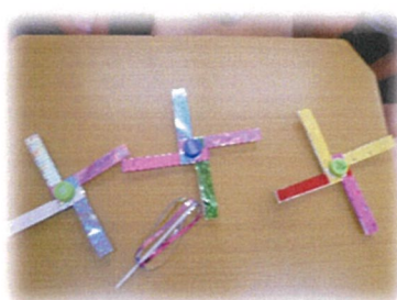
牛乳パックコマと折り紙シャボン