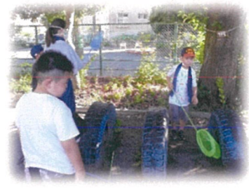
涼しい時間は、虫取りをしました。 セミ・かめむし? 捕まえたら逃がしたよ〜。