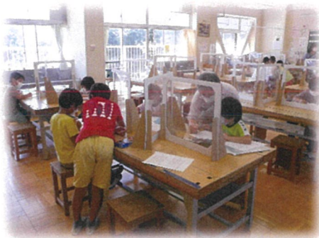
作るのも楽しかったし、遠くまで飛ばせたよ！！