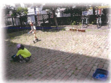
熱中症警戒アラートのない日に水鉄砲遊びをしました。