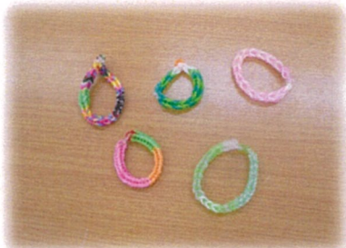
ゴムを編んでプレスレット