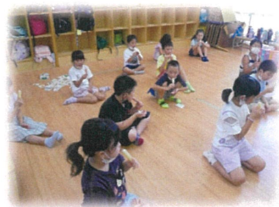
アイスを食べようデー♪