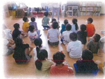
《かっぱのふうちゃん ライフジャケットですいすい》 水遊びが増えるので、読み聞かせで注意喚起をしました。