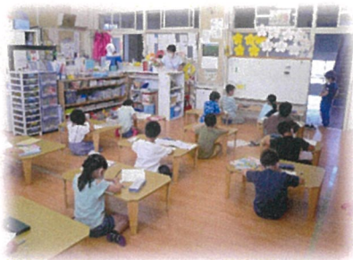
朝学習 集中して勉強しています。