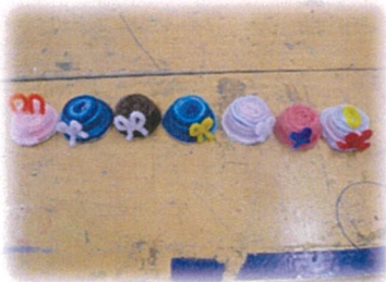
毛糸とボトルキャップで帽子作り