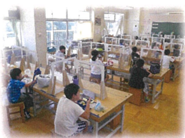
お昼は距離を取って黙食 2グループに分けています