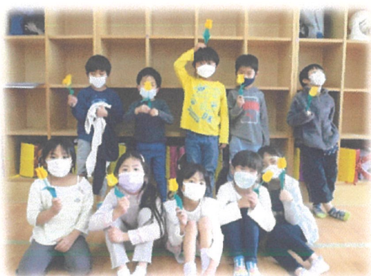
（1年生工作）折り紙でチューリップ をつくりました！