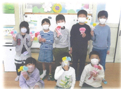
色とりどりのカーネーション おうちの方へのプレゼントです！