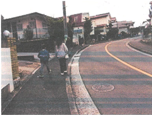
【六浦東地区ウォークラリー】前回に続き参加しました。今回は道を間違えないように気を付けて…「次はこっちなね!」チェックポイントでシールをもらいます。

11月が終わると、今年もいよいよ終わりが近づいてきます。今年はどうな年だったでしょうか、来年はどうな年になるでしょうか。学校に今年の入学式の写真が飾ってあります。その写真を見た1年生と2年生が「(自分たちが)どこに写っているかな」「これじゃない?」「こんなだったけ?」「あ、わかった、これはね…」と春を振り返って話をしていました。 写真の春の頃と比べると、今は表情も言葉も動きもより力強く見えます。子どもたちの成長は本当に「ぐんぐん」と音が聞こえそうな勢いです。たくさん遊んで、笑って、転んで、ケンカして、仲直りもして、言い合いも話し合いも何回もして、怒ったり泣いたりもしたけれど、やっぱり大きな声で笑うことがたくさんありました。 今年も大変お世話になりました。おかげさまで、キッズクラブはのんびりのびのび元気です。また来年もどうぞよろしくお願いいたします。よいお歳をお迎えください。