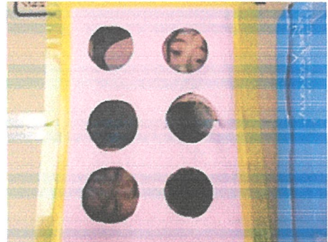
のぞいていますね「みえる〜?」「どう?」いったいどこからのぞいているのでしょう。