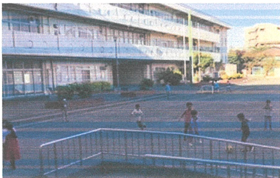
涼しくなったので、外遊びも思いきり