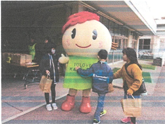
ゴールでは金沢区のポタンちゃんに迎えてもらいお土産まで頂いて「たくさん歩いたあ! いっぱいもらった!」