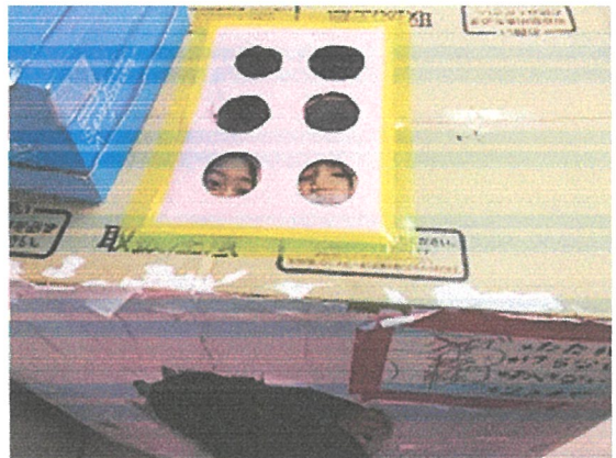
キッズルームにあるおうちに明り取りの天窓をつけました。つい、のぞきこんじゃう。「ね、ね、ここからも見える?」