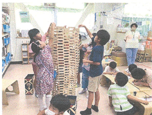
大きなカプラ作品を完成させるチームワーク その横では、色鉛筆を握って色ぬりに熱中

さて、学校のスポーツフェスティバルの開催が近づいてきました。毎日のように子どもたちの話題にもものぼります。楽しいことも苦労もあるのだそうで「大変なんだよね」と苦労を語りつつも「今日はこんなことを準備した！」ときらきらの笑顔で教えてくれます。本番へ向かう準備にも大きな達成感がありますね。季節の変わり目で体調を崩しやすい時期ですので、体も休めながら、十分に力を発揮できますように。