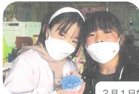
2月1日から3日まで コマ回し大会をひらきました!