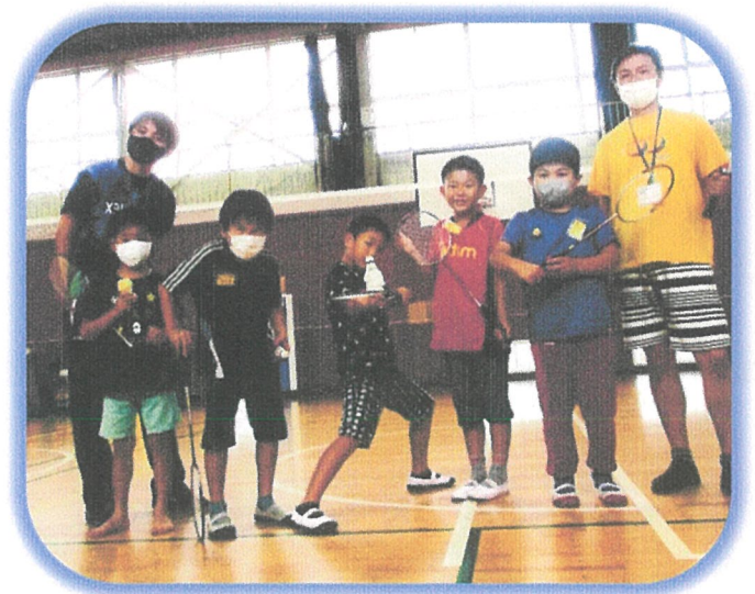
こうはん 後半チームのみなさん よくがんばりました！