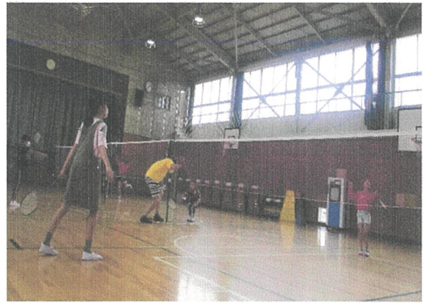
ぜんはん 前半チームのみなさん よくがんばりました！