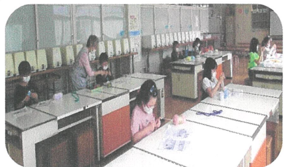
【5月のあみもの教室の様子】