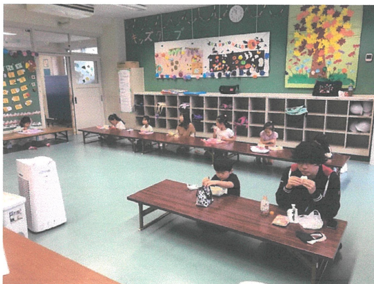
ある土曜日のお弁当の風景

ちょっと見づらいかもかもしれませんが、みんな、声を出さず、しっかり黙食しています。この一年、子どもたちは全員、ウイズコロナの生活様式を身につけ、活動してきました。ほんとうに、立派でした。