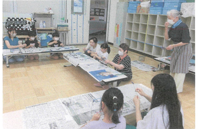
親子でラベンダースティック作り