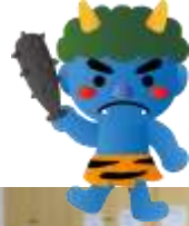
こども紙芝居 『こぶたのケンカ』