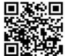
アラート発令お知らせQRコード