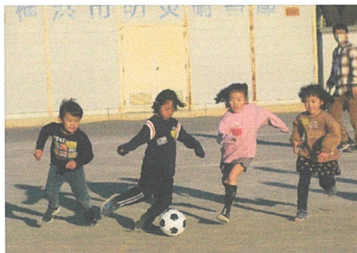
小山サッカー1回目