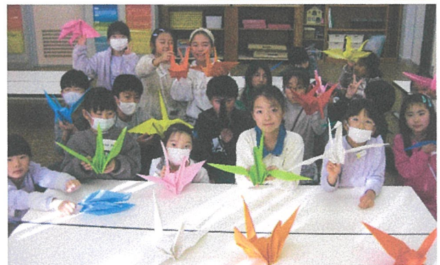
紙ふうせんと大きな折り鶴