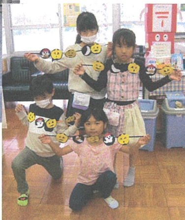
ハロウィンの ガーランド作り