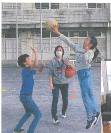
ドッジボールをしよう！