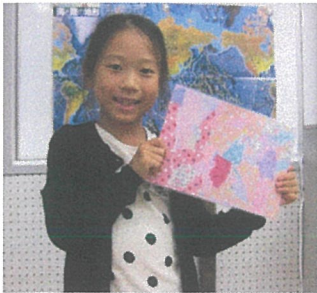
ちぎり絵の 下敷き作り