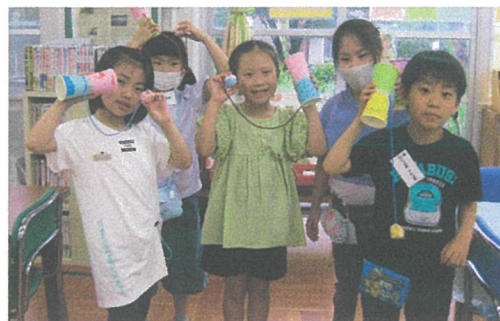
紙コップでけん玉づくり