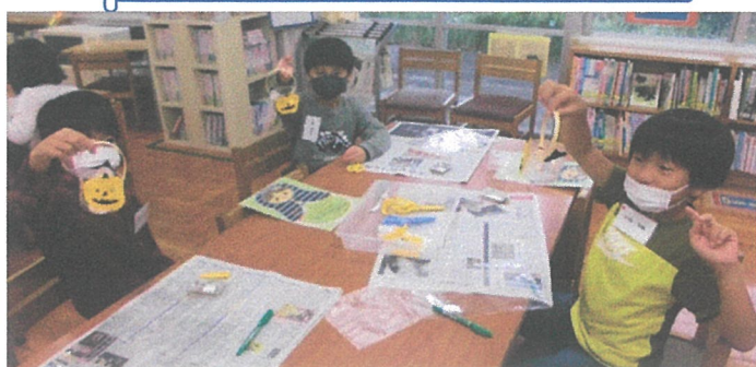
ハロウィンのらんたんづくり(10/12)