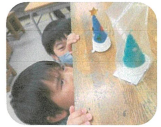
☆ツリー完成。みんなでポーズ！☆