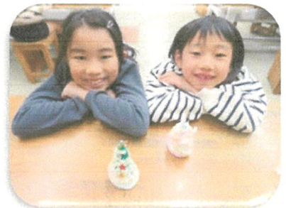
☆作品を前にポーズ！ 上手にできたかな？☆