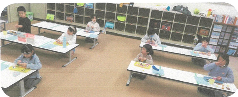
～おやつの様子～ 「前を向いておしゃべりはお休み」 黙食を心がけています。 早くみんなでお喋りをしながら 楽しいおやつタイムが過ごせる 世の中になりますように…