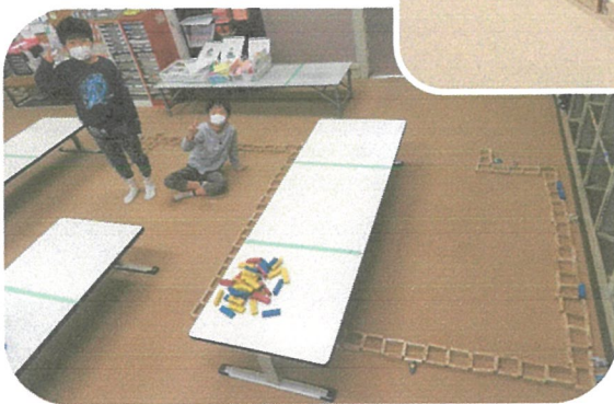
ジェンガを使って 巨大すごろくを 作りました！