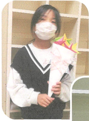
折り紙で 素敵な花束を 作りました🌸