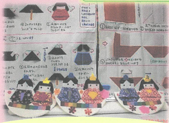
スタッフお手製のマニュアル