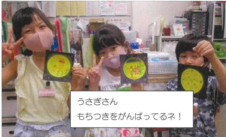
うさぎさん もちつきをがんばってるネ!