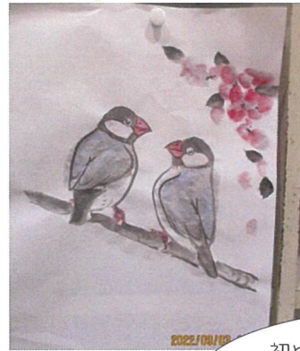
水墨画のプログラムでは 先生の作品(左)をお手本 にしながら、みんな思い いに好きな色に文鳥に色 付けしていました!