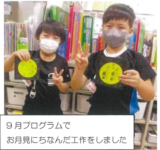
9月プログラムで お月見にちなんだ工作进行了