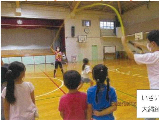
いきいきスポーツで 大縄跳びに挑戦しました!