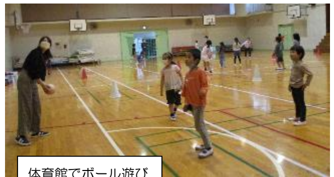
体育館でボール遊び

*キッズニュースは印刷物のほか、よこはまユースのホームページに掲載されています。ご家庭の事情などで 写真の掲載を望まれない場合は、キッズクラブまでご連絡ください。