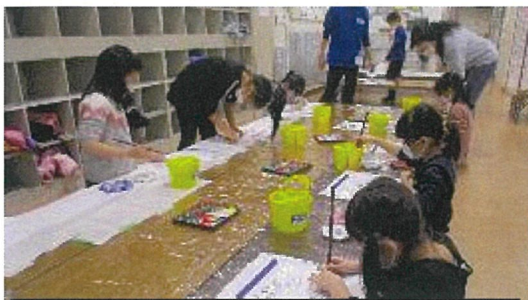
水墨画プログラムでピワやウミネコの作品を仕上げました

○申し込み多数の場合は抽選となります。申し込み締め切り日翌週に抽選結果(名簿)を貼りだしますの見に来てください。