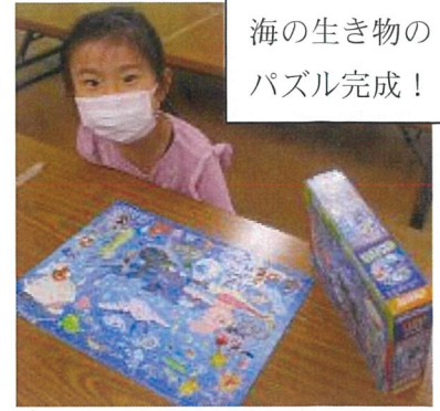
海の生き物のパズル完成！