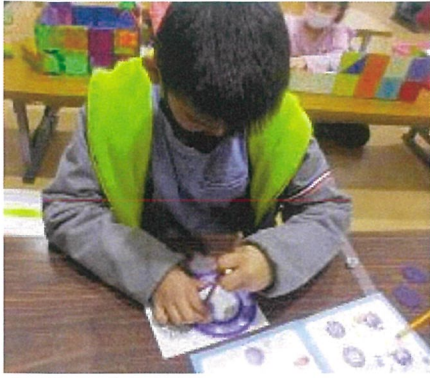
クルリグラフで綺麗な模様を描いています！