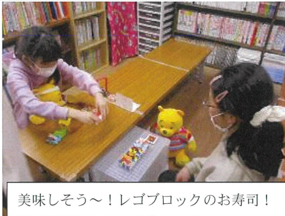
美味しそう～！レゴブロックのお寿司！