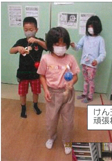
けん玉練習中 頑張れー!

◎一斉配信メールの登録が始まっています。 まだ登録をされていない方は、 以前お配りしたメール登録の流れに沿って 登録をしてください。