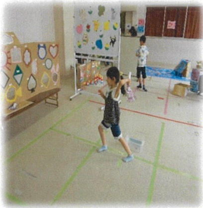
ペーパーロールゲーム