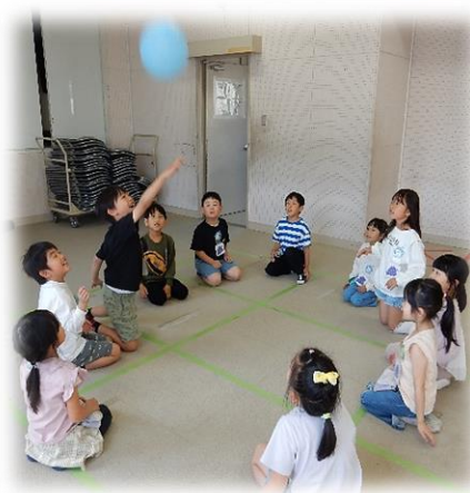
はじめての風船バレー