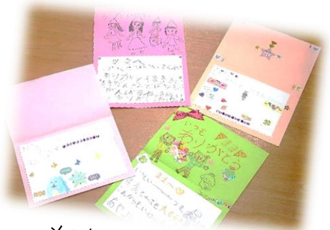
メッセージカード作り