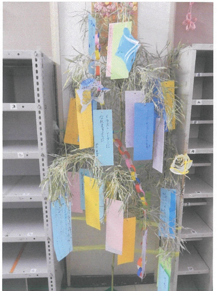
短冊に願い事を書いてもらいました