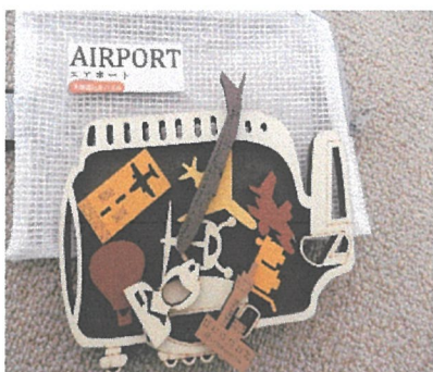
<一人遊び用の知育玩具>