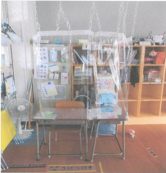
受付 手作りのシールドで覆っています。