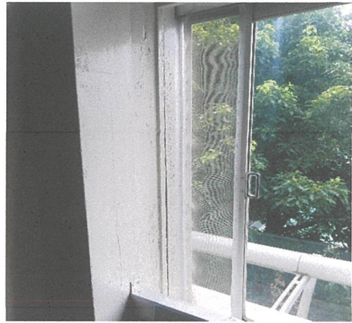
虫が入るので簡易網戸風に網を張りました。 スタッフさんの手作りです。