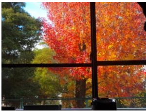
おとなりの公園も紅葉しています。 秋から冬へ。年の瀬が近いですね。

キッズニュースや法人ホームページに子どもたちの写真を掲載することがあります。ご家庭のご事情などで掲載を望まれない場合はキッズクラブまでお知らせください。