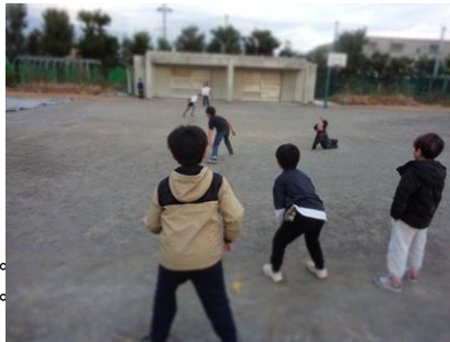
ドッジボールも盛り上がる。 「へい！こっち、ボールこっち！」 「もう、あつ！上着いらない！」

全力おいかけっこ 全力すぎてケンカも するけれど、 毎日一緒に遊びたい！ 「まって、まって！」 「いいよ！パス！」