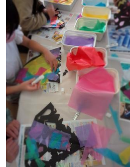
黒い画用紙に切り込みを入れて、開いて、 お花紙をパタパタパタ...