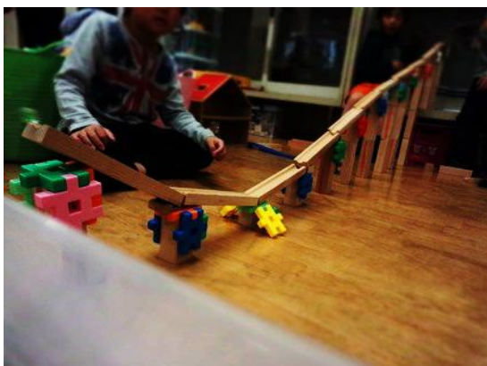
見えるでしょうか。勢いよく飛び出していくビー玉が。元気にぴょんと新学年に飛び出せますように！

日々、遊んで笑って怒って泣いて、大きく育ったあなたの新学年がすてきなものになりますように。