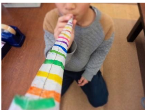
ぴゅーっと伸びるふきもどし。新しいことも多いから、ドキドキするかもしれない。そんな時は、ちょっと休みながら、のんびりのびのびすごせますように。