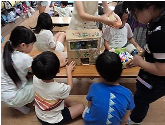
流れ星クラッカー教室とお店

星が飛び出すクラッカーを作る教室と星のガチャガチャができるお店が開催です。教えてくれるのは2・3・4・5年生たち。「つぎの人、どうぞ。」「星のガチャ作って！足りなくなった」