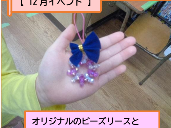
オリジナルのビーズリースと クリスマスカードを作りました