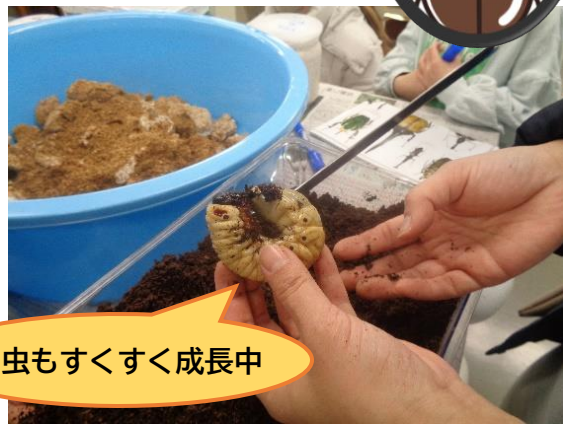
幼虫もすくすく成長中