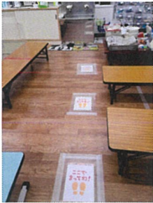
☆手洗い待ち位置ポップ

保護者の方のご理解・ご協力の下、安心・安全なキッズとして、子どもたちが楽しく遊べます。たくさんの笑い声が響くよう心がけていきます。