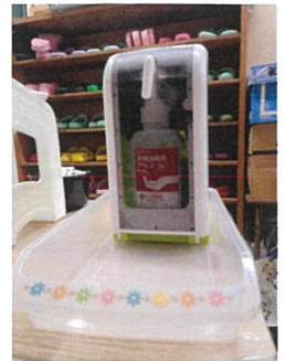
☆来所時、おやつ前後消毒