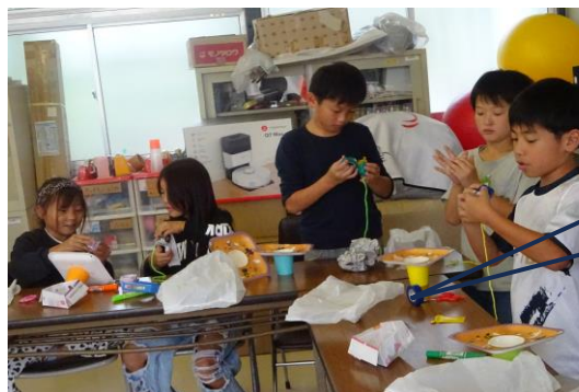
紙皿で けん玉作り