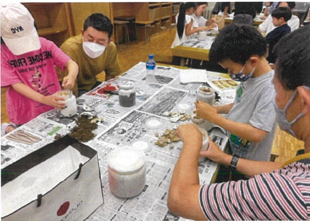
【プログラム写真/クワガタ研究会、親子プログラム作品他】