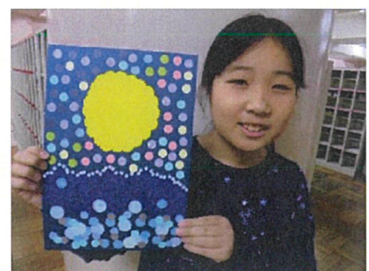
絵画サロンでは大小さまざまな大きさのシールを使ってドット絵を作りました。