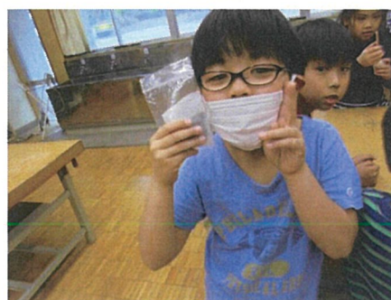
2月の無料クラフト『即席カイロを作る』の様子。「ケムリ出てる!」「めっちゃあつい!」など、とっても盛り上がりました。