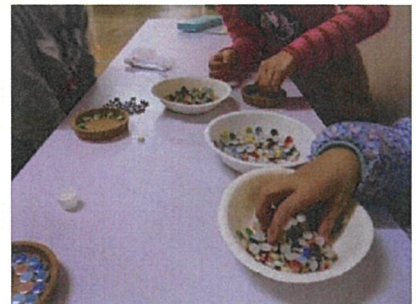
レジン工作やコルクコースターでは非常に細かい作業を丁寧にやっていました。おしゃべり大好きなみんなもこういう時はだまーって真剣にとりくみます。