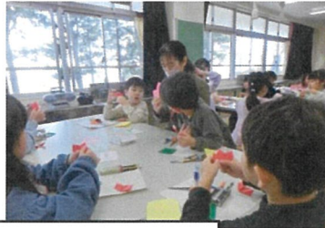
カーネーションのカードを作りました！