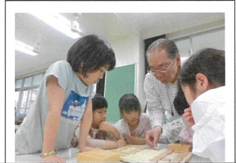
将棋をやってみよう！将棋のやり方を教えてもらったよ