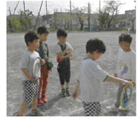
校庭活動（遊具遊びやフラフープが人気）