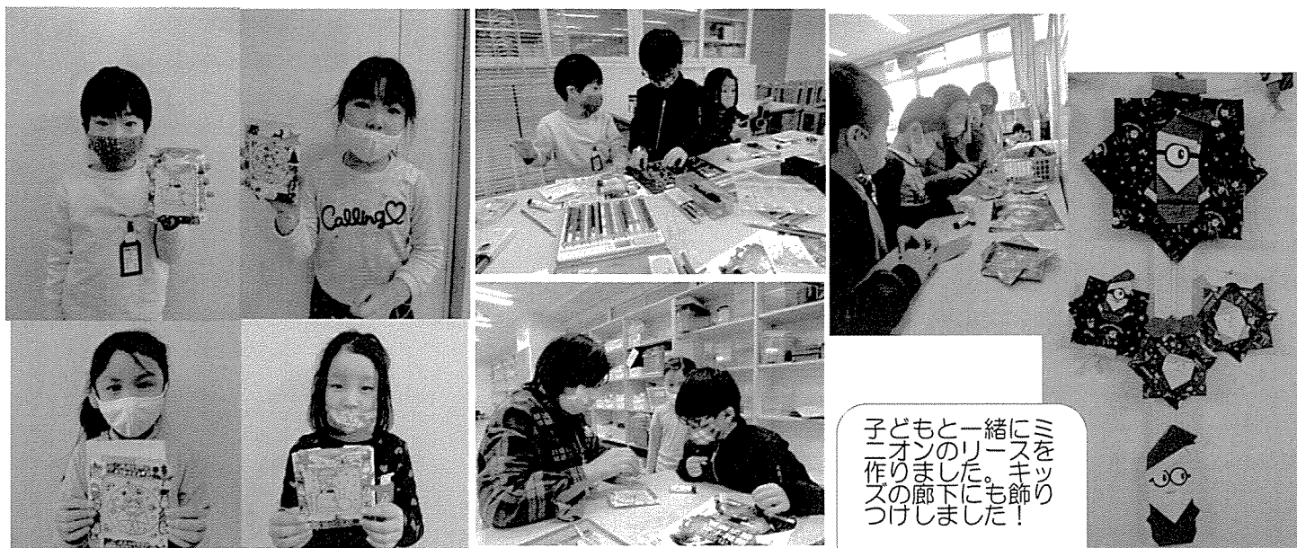
おどろきの仕掛けがあるクリスマスカードを制作しました！

子どもと一緒にミ ニオンのリースを 作りしました。キッ ズの廊下にも飾り つけしました！