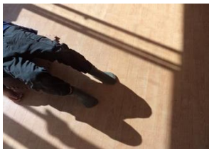
冬でも日向は暖かい まず、おなかを暖めて…

キッズニュースや法人ホームページに子どもたちの写真を掲載することがあります。ご家庭のご事情などで掲載を望まれない場合はキッズクラブまでお知らせください。