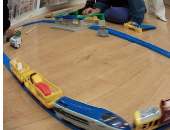
「ちょっとそこに座って！」 はい。あ、電車が走ってきましたね。 「お寿司がとどきまーす」 あれ、これは見たことがある！