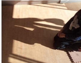
次は背中も暖めて 「あったかい〜」